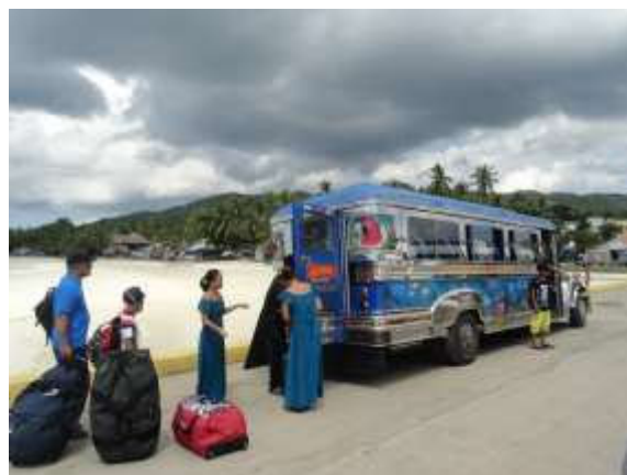
aankomst in Siquijor

De aankomst op siquijor was sprookjesachtig. Dames in mooie jurken stonden ons op te wachten bij een prachtige jeepney van het resort.