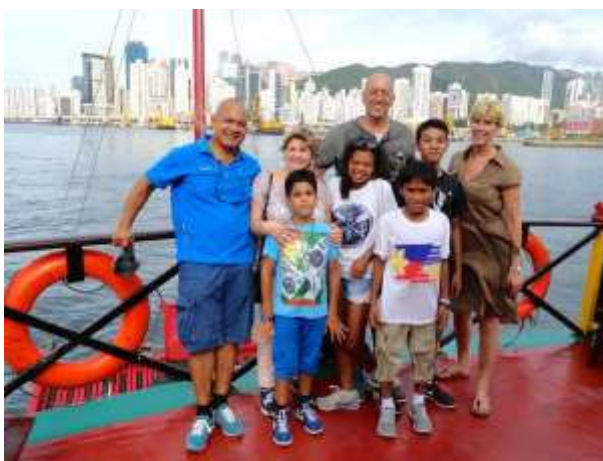
boottocht door de Victoriahaven.

's Avonds vertrokken we richting Nederland. En na een voorspoedige vlucht zetten we om 07.45 uur op 13 augustus weer voet op Nederlandse bodem.