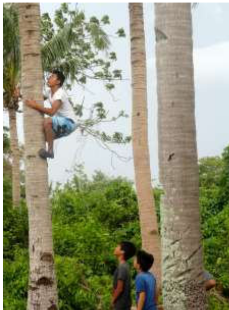
Als apen de boom in

Weer bij het strandje aangekomen stonden de tricycles al weer op ons te wachten. Onderweg stopten we nog bij een aantal palmbomen waar een "oude" man een kokosnoot uit zou halen. Hij klom als een aap in de boom, haalde een kokosnoot en liet ons proeven van de kokosmelk. De kinderen moesten natuurlijk laten zien dat ook zij als aapjes in zo'n boom konden klimmen. Het lukte ze alle 4.