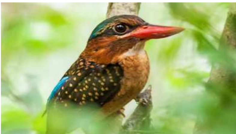
Dinsdag 6 oktober: Een mindanaobosijsvogel in het bos nabij de Filipijnse stad Bislig.