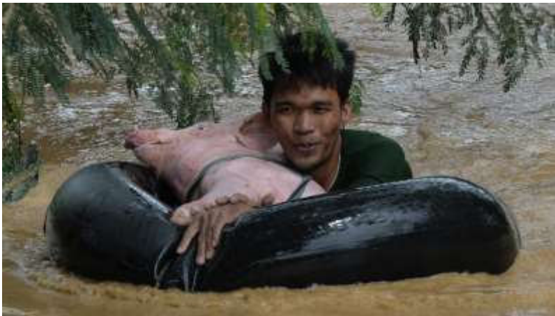
Maandag 19 oktober: Een Filipijnse man probeert zichzelf en zijn varken na een tyfoon te redden.