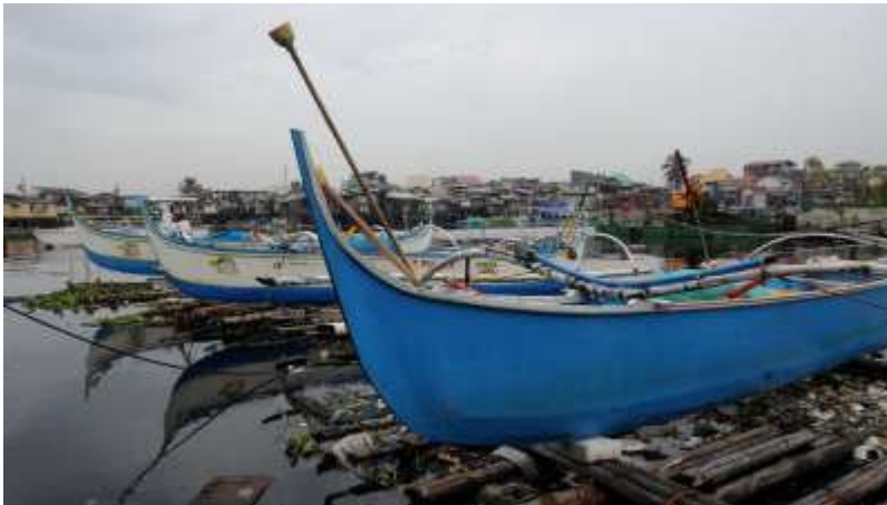
Zaterdag 17 oktober: Boten op de Filipijnen mogen het water niet in door een naderende tyfoon.