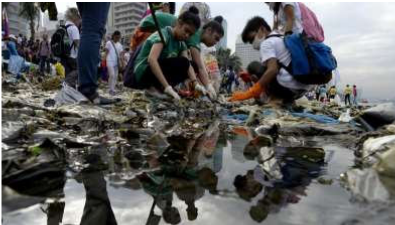
Zaterdag 19 september: Vrijwilligers in de Filipijnen ruimen al het afval uit het water op tijdens de nationale actie in het land.