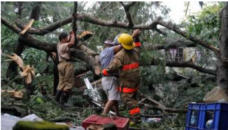
Maandag 19 oktober: Reddingswerkers en vrijwilligers verwijderen een boom die op een huis in de Filipijnse hoofdstad Manilla is terechtgekomen. De Filipijnen zijn maandag voor de tweede keer getroffen door tyfoon Koppu, die op zondag al een spoor van vernieling achter zich liet.