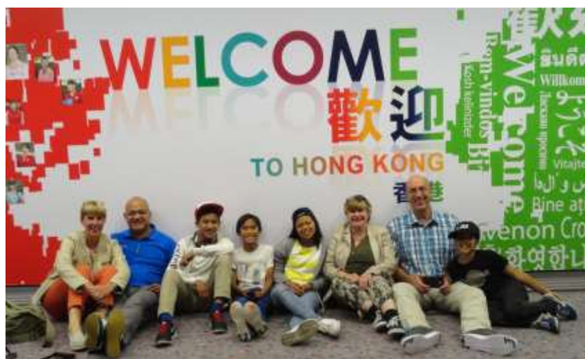
Overstappen in Hongkong

De vliegreis verliep (op een ongelukje na met een glas water over mijn schoot en dus een natte broek gedurende de hele reis) prima.