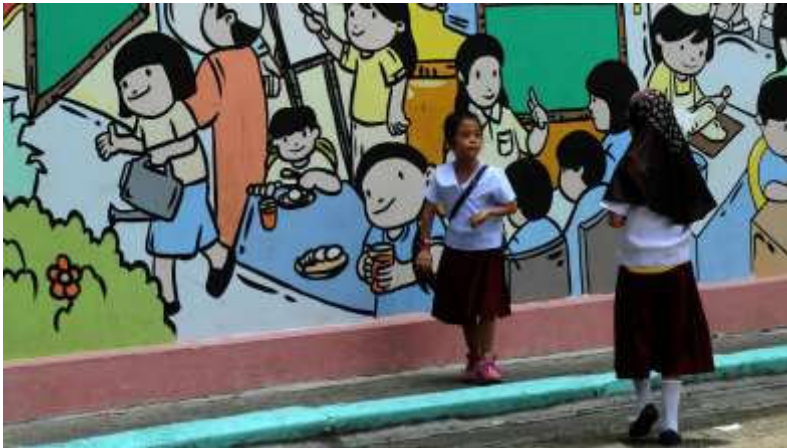
Donderdag 3 september: Twee Filippijnse meisjes wachten bij de muur van een school in Manilla voor de middaglessen.